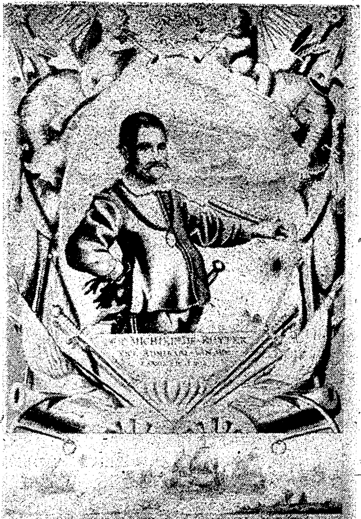
Schilderij van Michiel Adriaensz. de Ruyter, waarschijnlijk gemaakt door Hendrik Udemans.

Daar was zijn „heer“, de Hollandse zee rover Jan Jansz. van Haarlem, een sinjeur, die het met principes niet al te nauw nam. Hoewel hij te Haarlem vrouw en kinderen had, hield hij er in